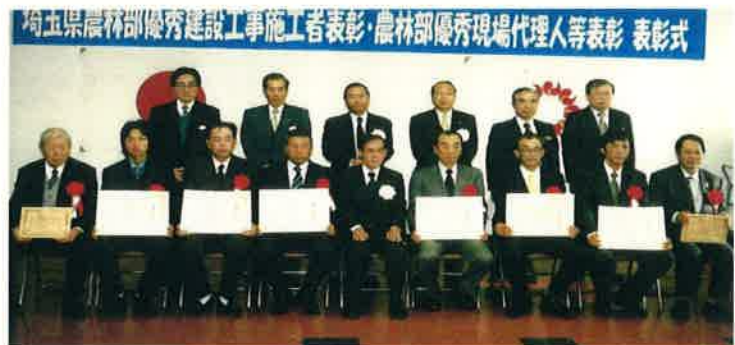
本庄農林振興センター 平成17年度優秀建設工事施工者現場代理人等表彰