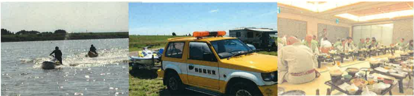
利根川でのバーベキュー大会！そして会社所有のジェットスキーも！