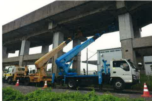
新幹線高架橋の雨どいを交換してます 先輩が計った長さに材料を切ったりします。