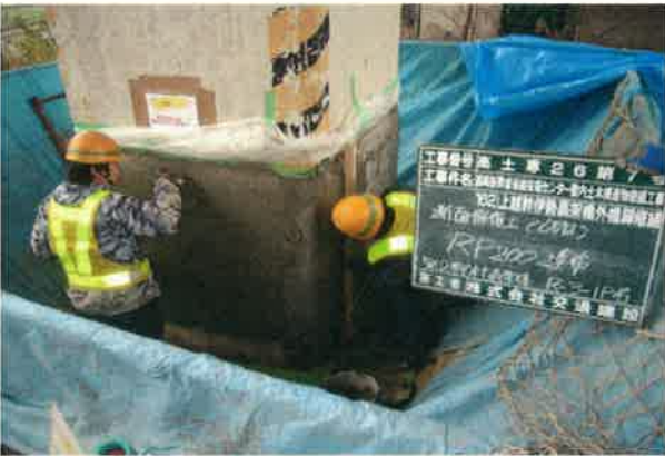
新幹線高架橋の柱の補強をします 先輩が塗る材料を作って渡します。