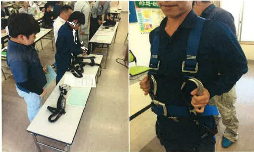
ハーネス型安全带 特別講習のようす