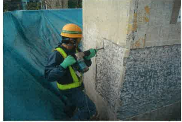
新幹線高架橋の柱の補強をします 機械で表面を削る作業です。