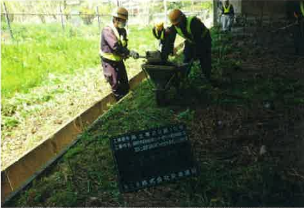
新幹線高架下の側溝の土砂を清掃してます スコップを使った簡単な作業です。