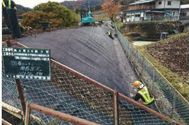
JRの敷地内に草が生えないようになっています ハンマーで防草シートにピン打をします。