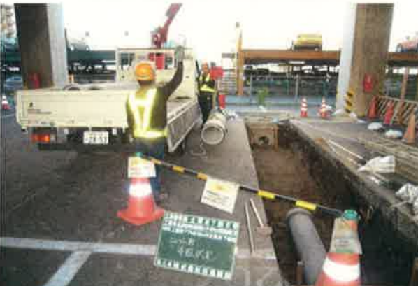
新幹線高架下にある排水管の修繕をしています 先輩が操作するクレーンを誘導します。